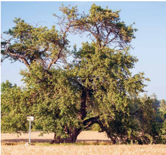
Oti metsõunapuu Viljandimaal

Looduse üksikobjektid leiab nii PRIA põllumassiivide veebikaardilt kls.pria.ee/kaart kaardikihtide alt nimega „Looduse üksikobjektid“ kui ka Maa- ja Ruumiameti kaardirakendusest geoportaal.maaamet.ee ja EELIS andmebaasist infoleht.keskkonnainfo.ee .