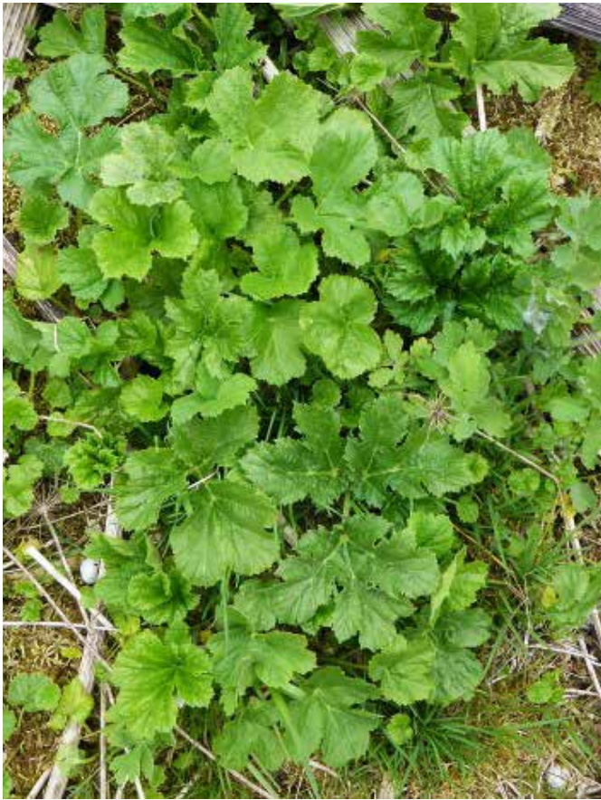
Tärkav Sosnovski karuputk