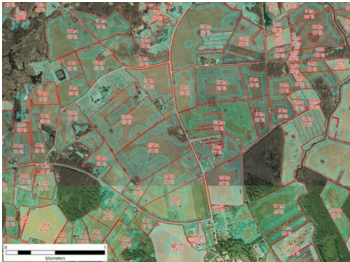
Joonis 1. Näide maastikuelementide mõjualade erinevatest katvustest erineva suurusega tootmispõldudel mitmekesises põllumajandusmaastikus