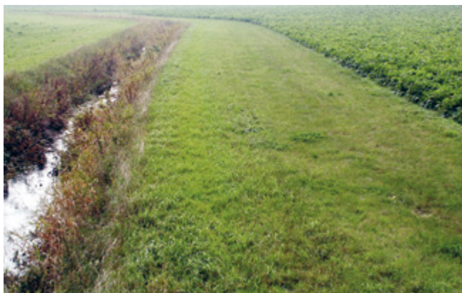
Puhverriba niitmine pole kohustuslik, vaid üks võimalusi.

Kõik ülaltoodud vooluveekogud on Eestis kaardistatud ja toetuste taotlejatele kättesaadavad Maa-ameti kaardirakendusest ja Keskkonnaregistrist http://register.keskkonnainfo.ee .