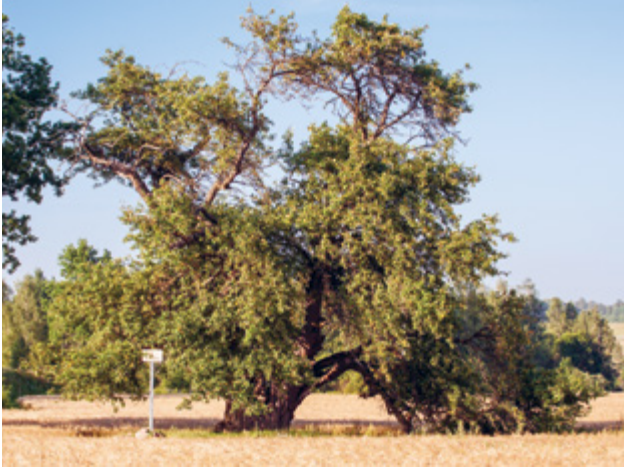
Oti metsõunapuu Viljandimaal.

Analoogne nõue on HPK nõudena kehtinud alates 2010. aastast, täpsustatud on konkreetsed looduse üksikobjektid, mis võivad põllumajandusmaal esineda.