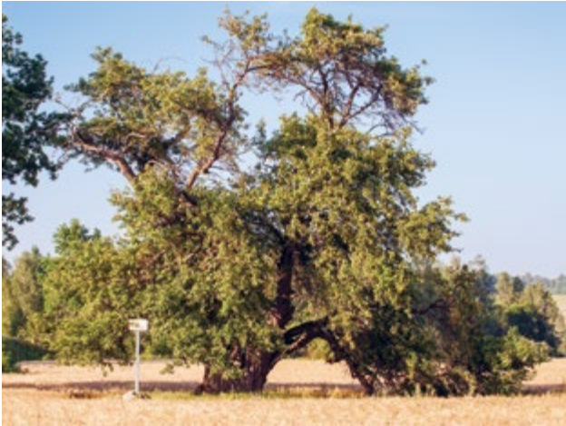
Oti metsõunapuu Viljandimaal.

Analoogne nõue on HPK nõudena kehtinud alates 2010. aastast, täpsustatud on konkreetset looduse üksikobjektid, mis võivad põllumajandusmaal esineda.