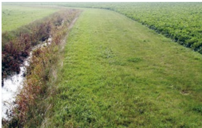
Puhverriba niitmine pole kohustuslik, vaid üks võimalusi.

Kui peakraav, kanal või maaparandussüsteemi eesvooluks olev kraav on Eesti topograafia andmekogu põhikaardile kantud joonobjektina, on puhverriba ulatuse arvestamise lähtejooneks süvendi serv.