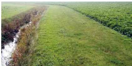
Puhverriba niitmine pole kohustuslik, vaid üks võimalusi.

Nõute täitmist kontrollib Keskkonnaamet. Kohapeal kontrollitakse eelkõige seda, kas taotleja on kasutanud vastavatesse nimistutesse kuuluvaid (vt keskkonnaministri 24. juuli 2019. aasta määrus nr 28) aineid (ostudokumendid, kanded põlluraamatusse, hoidlate visuaalne kontroll) ning kas kasutamisel on toimunud ohtlike ainete, nt biotsiidide ja pestitsiidide lekkeid hoidlast või taarast. Kontrollitakse ka taimekaitseadmete pesemise ja heitvee ärajuhtimise kohti.