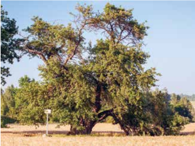
Oti metsõunapuu Viljandimaal.

Analoogne nõue on HPK nõudena kehtinud alates 2010. aastast, täpsustatud on konkreetset looduse üksikobjektid, mis võivad põllumajandusmaal esineda.